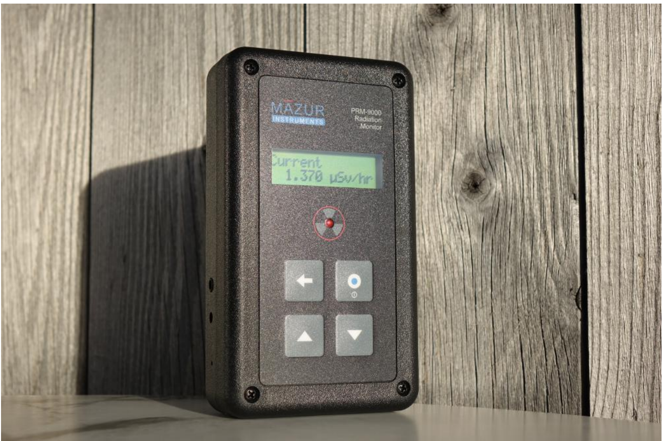
PRM-9000 ein Meisterstück der Geigerzählerbaukunst in Reinstform!

Die Tendenzen, wann der RD1008 und wann der PRM-9000 mehr Sinn machen, sollten aus meiner Seite herauszulesen sein.