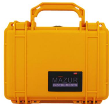
PRM Hard Field Case (Yellow)