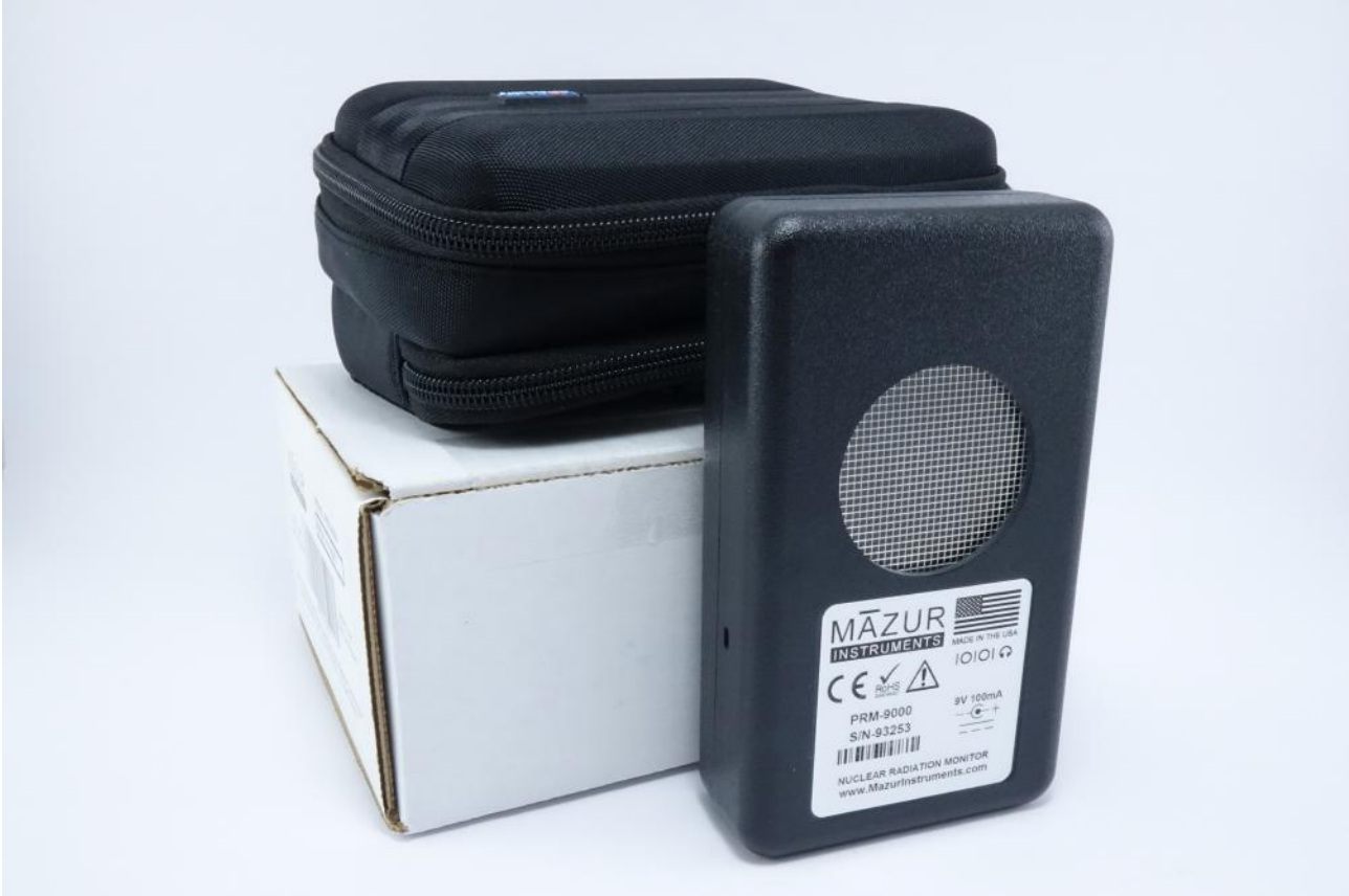
Stand Winter 2020