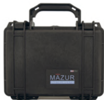
PRM Hard Field Case (Black)