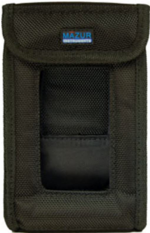
Ballistic Nylon Protective Case